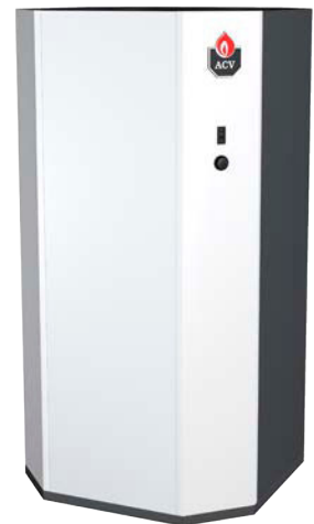
Jumbo 800 Roestvrijstalen boiler met grote capaciteit

Door de jaren heen heeft ACV een brede waaier aan kennis vergaard voor het berekenen van de behoefte aan sanitair warm water en verwarming in tertiaire projecten. Om deze knowhow te delen, heeft ACV een eenvoudig en efficiënt softwareprogramma ontwikkeld: Archimedes . Om het nog gebruiksvriendelijker te maken is deze software vanaf nu ook online raadpleegbaar.