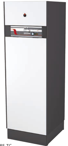
HeatMaster® 85 TC Condenserende gasketel met dubbele functie

ACV biedt een ruim assortiment oplossingen aan voor omgevingen met een grote vraag naar warm water zoals de zorgsector, hotels, sportcentra, scholen, industrie, ... en omvat zowel boilers, condenserende als niet-condenserende ketels. Voor de tertiaire markt ligt de focus op productie en opslag van sanitair warm water, de kracht van ACV, en condenserende gasketels, met roestvrij stalen warmtewisselaar. Het assortiment Smart , Jumbo , HRI , HRs en LCA zijn de voornaamste boilers voor de tertiaire markt. Wat de ketels betreft, denken we hierbij vooral aan het gamma HeatMaster® , Prestige en alle mogelijke cascade-opstellingen hiervan. Bij ACV staat een team tertiair klaar om al uw vragen te beantwoorden en samen met u op zoek te gaan naar de beste oplossing voor uw project.